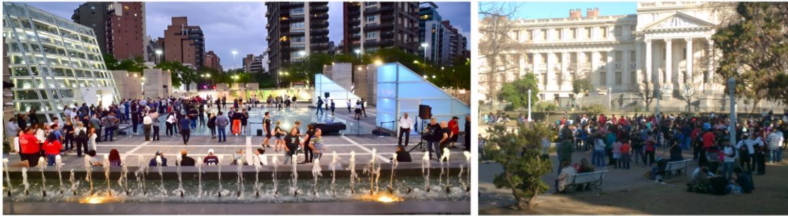
Figura 1. Formas emergentes de apropiación del espacio público urbano. Consumos culturales asociados con aplicaciones y visualizaciones en redes sociales. Izquierda: Explanada Museo Metropolitano de Córdoba, Plaza España. Derecha: Movimiento Trap urbano Córdoba, Paseo Sobremonte. Elaboración propia (2025).

En cuanto a los aportes, se pudo identificar una estrecha relación entre la plataformización urbana y determinadas dinámicas capaces de generar centralidades emergentes. Esta dialéctica entre espacio físico, prácticas sociales y consumos culturales son intermediadas por tecnologías digitales y plataformas, dando lugar a un fenómeno de mediatización urbana.